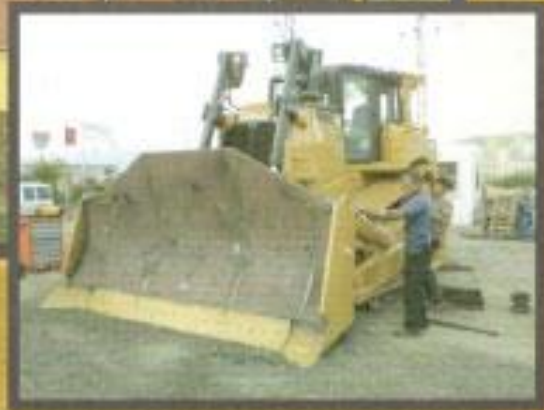
Dozer Bıçağı Komple Hardox Kaplama