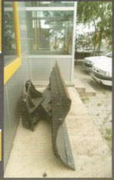
Beko Loder Ön Kar Küreme Bıçağı İmalatı