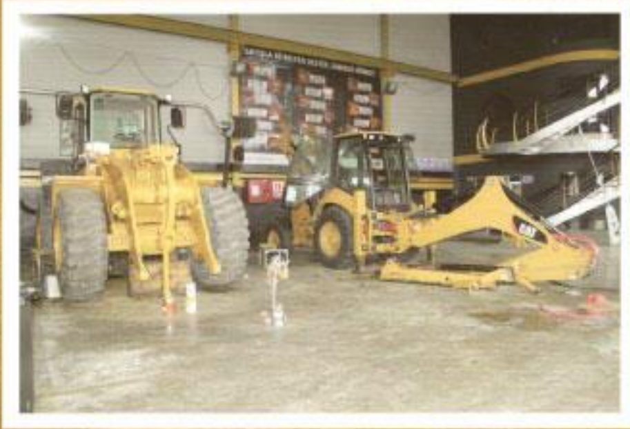
Servis Atölye Sahamız