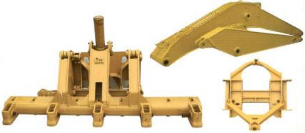
Riper Ve Bom İmalatı